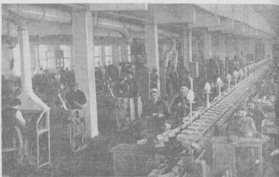
Один миллион сто тысяч пар обуви выпустит в 1960 году Чирчинская обувная фабрика. Здесь начали работать две новые поточные линии и четыре конвейера, выпускающие шьюльную и гусариную обувь. НА СНИМКЕ: новый цех шьюльной и гусаринской обуви.