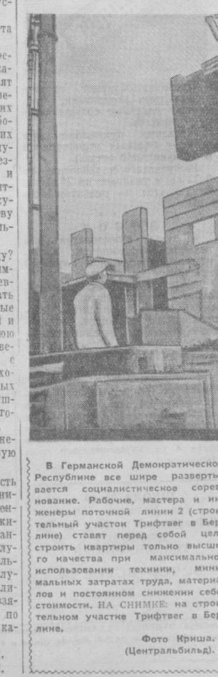
В Германской Демократической Республике все шире разветвляется социалистическое соревнование. Рабочие, мастера и инженеры поточной линии 2 (строительный участок Трифтваг в Берлине) ставят перед собой цель строить квартиры только высочайшего качества при максимальном использовании техники, минимальных затратах труда, материалов и постоянном снижении себестоимости. НА СНИМКЕ: на строительном участке Трифтваг в Берлине.

ядра и ставить таящуюся в нем энергию на службу человеку. С первых минут работы выставки включаются в работу студенты и переводчики. Их бурно засыпают всевозможными вопросами: об организации труда на советских заводах и фабриках, о системе заработной платы, о медицинском обслуживании и образовании о жизни, труде и отдыхе советских людей. Посетители очень живо воспринимают даваемые им работниками советской выставки пояснения, подчас спорят, дискутируют, но неизменно приходят к выводу — выставка впервые открыла им глаза на жизнь советских людей, их устремления и чаяния, на те грандиозные успехи, которых добилась первая в мире социалистическая страна за 42 года своего существования. «Москва — это прекрасно, — делится своими впечатлениями в книге отзывов гаванец А. Раствельно. — Что касается моего мнения о выставке, то я уверен, что ваше правительство вышло из народа, является народным и служит на благо народа». Первый день работы советской выставки в Гаване свидетельствует о ее большом успехе среди кубинцев. Только за первые пять часов выставку посетило около 35 тысяч человек.