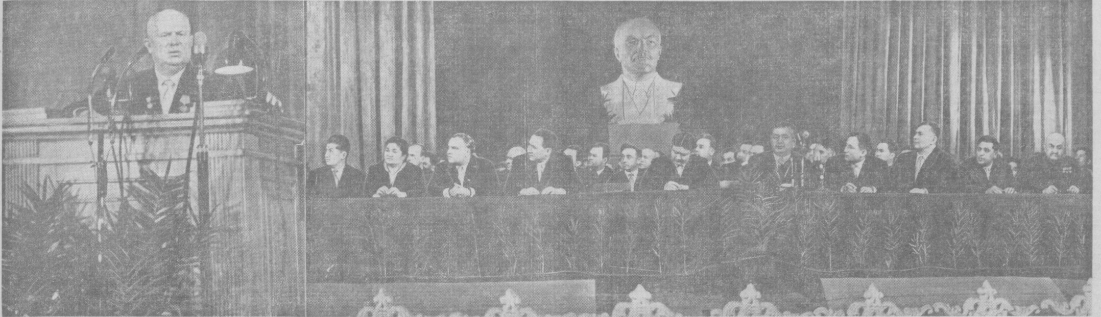
XV съезд Компартии Узбекистана. НА СНИМКЕ: президиум съезда. На трибуне — Первый секретарь ЦК КПСС, Председатель Совета Министров СССР товарищ Н. С. Хрущев.