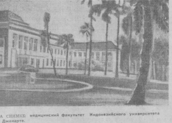
НА СНИМКЕ: медицинский факультет Индонезийского университета в Джакарте.

ОТКРЫТИЕ КОНФЕРЕНЦИИ АРАБСКИХ СТРАН ПО ВОПРОСУ ОБ ОБРАЗОВАНИИ БЕИРУТ, 9 февраля. (ТАСС). Сегодня здесь открылась конференция представителей министерств образования арабских стран, созданная по инициативе ЮНЕСКО. Конференция, которая продлится до 13 февраля, обсудит проблемы национального образования в арабских странах.