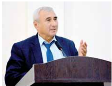
Дан хис қилдим. Давлатимиз раҳбари Фармонида мувофиқ "Меҳнат шухрати" ордени билан тақдирланганим ҳаётимнинг энг ёрқин саҳифаларидан бири бўлди. Бу — мавжуд имкониятлардан, вақтдан баҳоли қудрат самарали фойдаланаётганимизга берилган мукофот.

Бугунги давр шундайки, қилинган ишлар чексиз кўп, бироқ энди бажариладиган ишлар ундан-да кўп. Эҳ-эҳ, ишлайдиган, яшайдиган, Ватанини буюк Ватанга айлантирадиган замон келди. Вақтнинг шиддати... Ҳар бир куннинг дарёлаганиши... Қани, иложи бўлса, бир сутка 30 соат бўлса, дейсиз. Лекин 24 соатда ҳам йилларнинг, ҳа-ҳа, йилларнинг ишини бажаришга имкон топилмапти. "Бир онинг баҳосини ўлчамоқ учун, Олтиндан тарози, оломсдан тош оз", дейди-ку шоир.