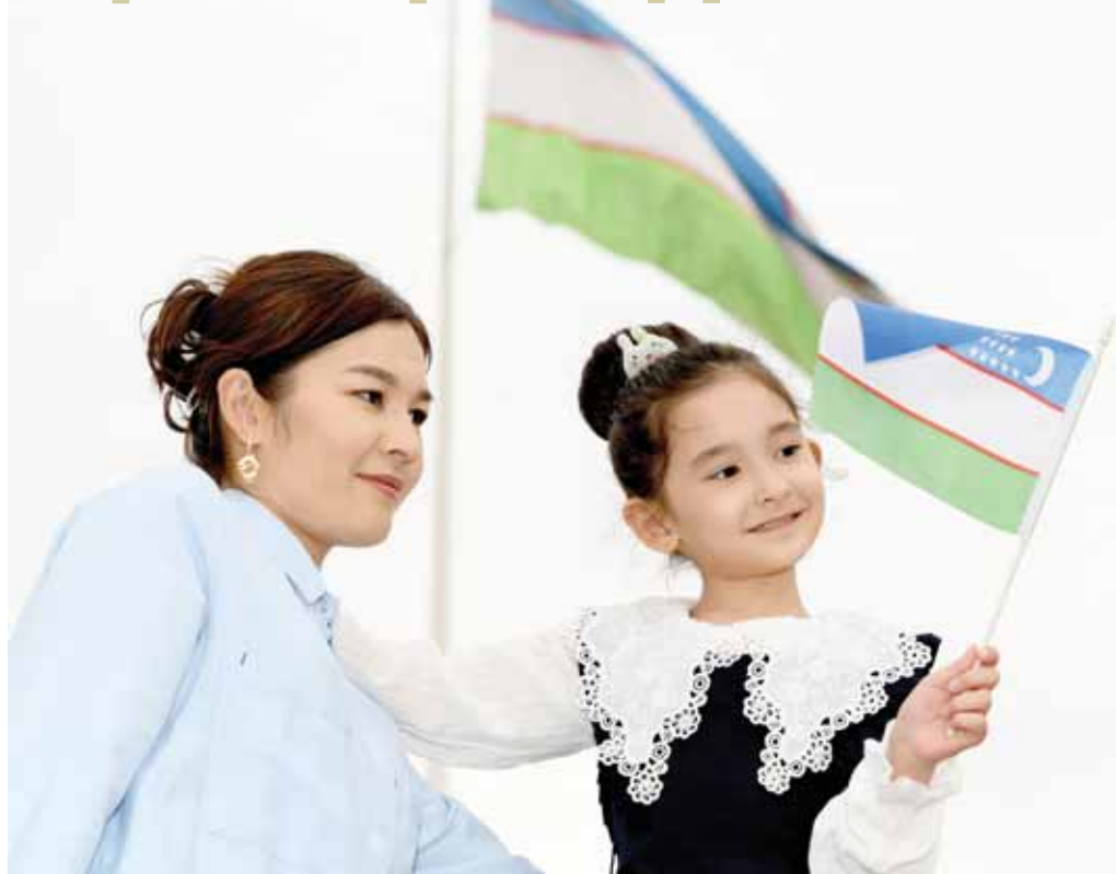
Кўп миллатли Ўзбекистон халқи давлат мустақиллигининг 32 йиллигини нишонлашга тайёргарлик кўраётган бир пайтда "Ижтимоий фикр" республика жамоатчилиги фикрини ўрганиш маркази томонидан жамоатчилик фикри сўрови ўтказилди.