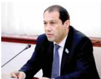
Равшан МАМУТОВ, Олий Мажлис Қонунчилик палатасининг Аграр ва сув хўжалиги масалалари кўмитаси раиси, «Дўстлик» ордени соҳиб.

Бугун юртимизда барча соҳа қатори, аграр секторни ривожлантириш, аҳолининг қишлоқ хўжалиги маҳсулотларига бўлган талабини қондириш муҳим йўналишлардан бири сифатида қаралмоқда. Шу боис озиқ-овқат хавфсизлигини таъминлаш, қўлай агробизнес муҳити ҳамда қўшилган қиймат занжирини яратиш, соҳада экспорт салоҳиятини ошириш ва инвестициявий жозибадорлиқни яхшилаш, айниқса, аграр тармоқда илм-фан ютуқларини жорий қилиш бўйича кенг қўламли ислохотлар амалга оширилаётди.