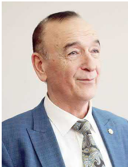
Шавкат АЮПОВ, Ўзбекистон Қаҳрамони, Ўзбекистон ХДП Марказий Кенгаши аъзоси:

— Бир неча кун аввал Хитойдан илмий сафардан қайтиб келдим. Мазкур мамлакатда юртимиз олимлари билан ҳамкорлик қилиш кўламини кенгайтириб бормоқда. Бу октябрь ойи бошида Тошкентда Марказий Осиё математик олимлари иштирокида ўтказилган форум олдидан учрашув бўлди. Шу кунларда мазкур нуфузли анжуманга тайёргарлик ишлари билан бандман.