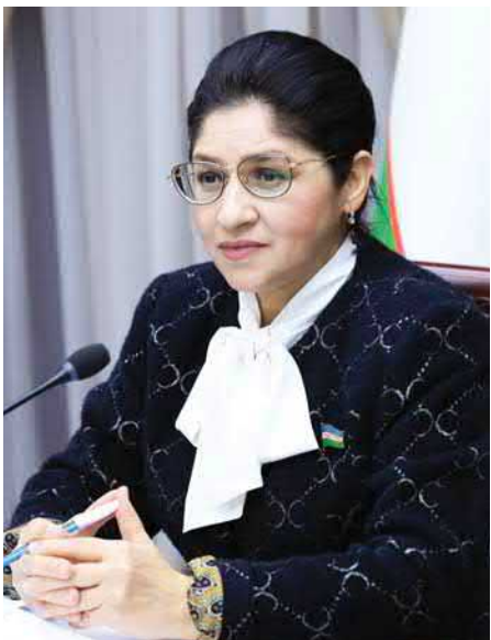
Малика ҚОДИРХОНОВА, Олий Мажлис Сенатининг Хотин-қизлар ва гендер тенглик масалалари қўмитаси раиси, Ўзбекистон ХДП аъзоси:

— Сўнги йилларда мамлакатимизда амалга оширилаётган ислохотларнинг барчасида инсон қадрини ва халқ манфаатларини ҳамма нарсдан устун бўлиши аниқ кўрсатиб берилганини кўриш мумкин.