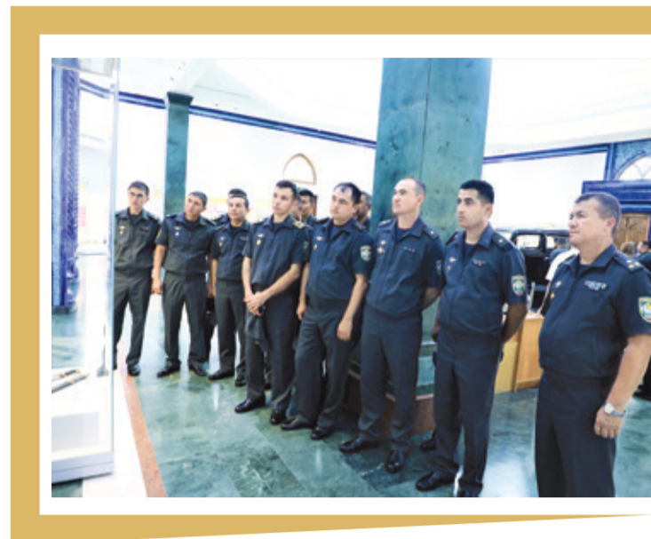
Tashrif so'ngida mashg'ulot rahbari hamda ishtirokchilari tomonidan bu kabi amaliy mashg'ulotlarni muntazam tashkillashtirishga kelishib olindi.

Ishtirokchilar ushbu tashrifdan mamlakatimizdagi millat oydinlari haqida qisqacha ma'lumotlar olish bilan bir qatorda, o'zbek xalqining ijtimoiy, madaniy va ma'naviy hayotida tutgan o'rni xususida zarur xronologik ma'lumotlar bilan tanishdi.