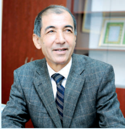
Sirojiddin SAYYID, O'zbekiston xalq shoiri

Vatan bag'rida bo'l bedor, Vatan hech qayga ketgan yo'q, G'amu dardiga bo'l darkor, Vatan hech qayga ketgan yo'q.