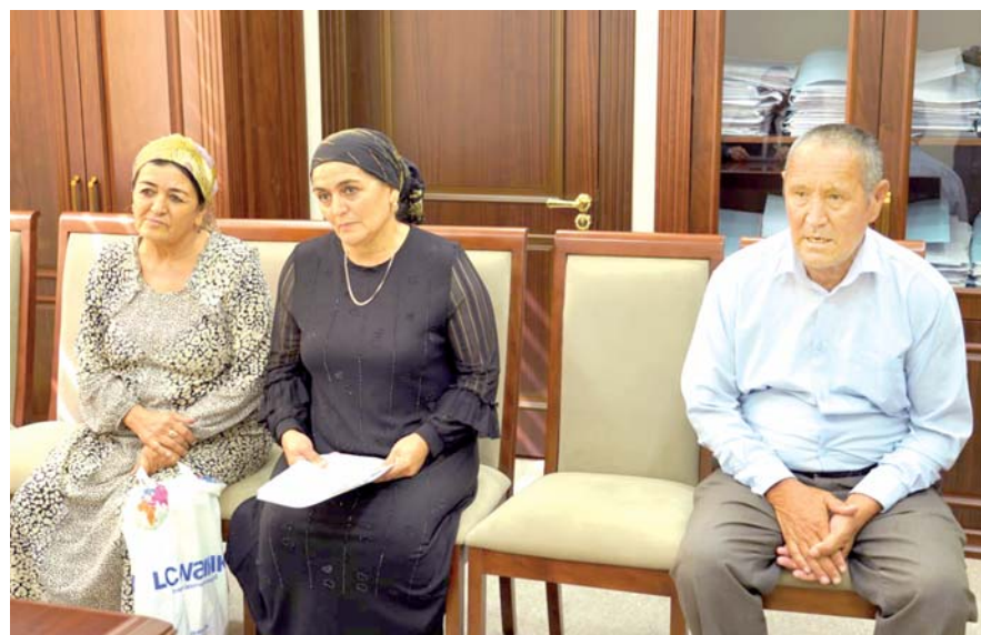
Генеральной прокуратуры, МВД, Верховного суда, эксперты.

Комитетом Сената по судебноправовым вопросам и противодействию коррупции был организован очередной прием, в ходе которого рассмотрены обращения около ста граждан, прибывших из разных регионов республики. В нем участвовали представители