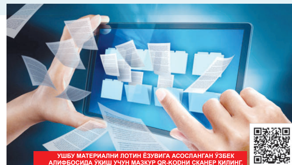
УШБУ МАТЕРИАЛНИ ЛОТИН ЁЗУВИГА АСОСЛАНГАН ЎЗБЕК АЛИФБАСИДА УҚИШ УЧУН МАЗКУР QR-КОДНИ СКАНЕР ҚИЛИНГ.

Пенсияларни ҳисоблаб чиқариш учун қабул қилинадиган ўртача ойлик иш ҳақининг энг юқори чегараси пенсияни ҳисоблаш базавий миқдорининг ўн баробаридан ўн икки баробарига оширилди. Қувонарлиси, пенсия тайинлашда ҳисобга олинган ўртача ойлик иш ҳақи миқдори 3 миллион 240 миң сўмдан юқори бўлган пенсияонерларнинг нафақалари автоматик тарзда қайта ҳисоб-китоб қилиб чиқилди. Фуқароларнинг пенсия жамгармасига мурожаат этишига эса зарурат қолмади. Нафақаси ошадиган фуқароларга олдиндан СМС хабар юборилди.