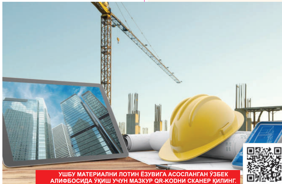
УШБУ МАТЕРИАЛНИ ЛОТИН ЁЗУВИГА АСОСЛАНГАН ЎЗБЕК АЛИФБАСИДА УҚИШ УЧУН МАЗКУР QR-КОДНИ СКАНЕР ҚИЛИНГ.

Шунингдек, ушбу қарорнинг 17-банди билан инспекцияимиз зиммасига туман (шаҳар) ҳокимликлари ва бошқа тегишли ташкилотлар билан биргаликда 2023 йил 1 сентябрдан бошлаб режа-график асосида республиканинг сейсмик фаол зонасида жойлашган сейсмик хавфсизлиги III-IV тоифага кирувчи кўп квартиралли уйларни ўрганиш орқали уйлардаги умумий фойдаланиладиган жойларда (зинапола йўлаклар, чердак ва умумий фойдаланиладиган ошхоналарда) ўзбошимчалик билан қурилган конструкцияларни ҳамда кўп квартиралли уйлар, шу жумладан, уларнинг ертўла ва биринчи қаватидаги