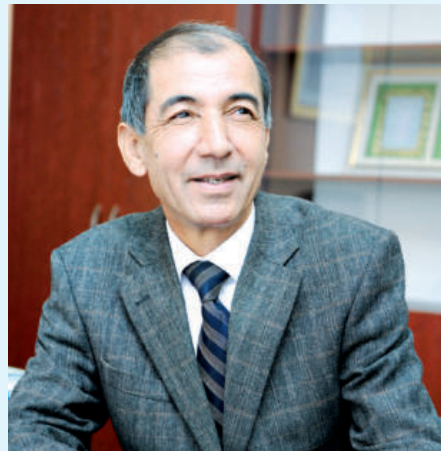
Сирожиддин САЙИД, Ўзбекистон халқ шоири

Ватан бағрида бўл бедор, Ватан ҳеч қайга кетган йўқ, Ғаму дардига бўл даркор, Ватан ҳеч қайга кетган йўқ.