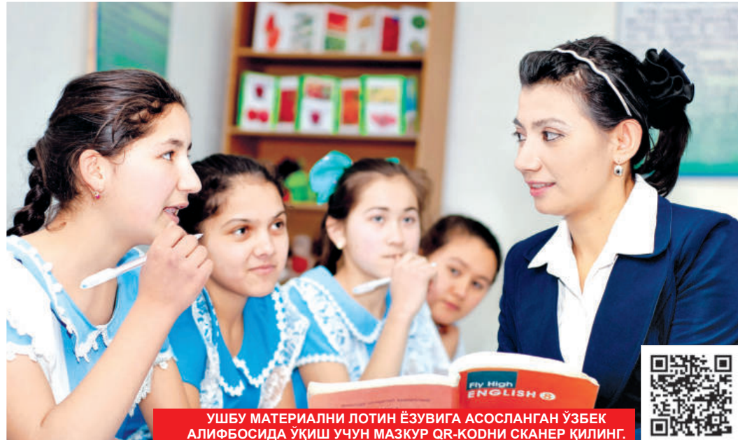
УШБУ МАТЕРИАЛНИ ЛОТИН ЁЗУВИГА АСОСЛАНГАН ЎЗБЕК АЛИФБОСИДА ўқиш учун МАЗКУР QR-КОДНИ СКАНЕР ҚИЛИНГ.

Айни пайтда таълим тизимида, хусусан, мактаб таълими соҳасида ўз ечимини кутаётган долзарб масалалар ҳам талайгина. Йиғилишда бу борада қатор муаммолар мавжудлиги таъкидланди. Ху-