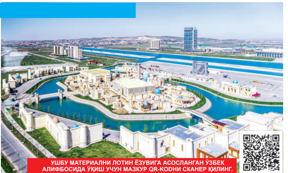
УШБУ МАТЕРИАЛНИ ЛОТИН ЁЗУВИГА АСОСЛАНГАН ЎЗБЕК АЛИФБОСИДА УҚИШ УЧУН МАЗКУР QR-КОДНИ СКАНЕР ҚИЛИНГ.

“ БУГУН МАРКАЗИЙ ОСИЁ ДУНЁДА ЯГОНА ВА ЯХЛИТ МИНТАҚА СИФАТИДА ТАНИЛИБ БОРМОҚДА. БУНДАЙ МАҚОМ НАФАҚАТ БУГУН МИНТАҚАНИНГ ГЕОСИЁСИЙ ҲОЛАТИНИ МУСТАҲКАМЛАЙДИ, БАЛКИ ТАШҚИ МАЙДОНДА УМУМИЙ МИНТАҚАВИЙ МАНФААТЛАРНИ ҲИМОЯ ҚИЛИШ УЧУН ЯНАДА КЕНГ ИМКОНИЯТЛАР ЯРАТАДИ.