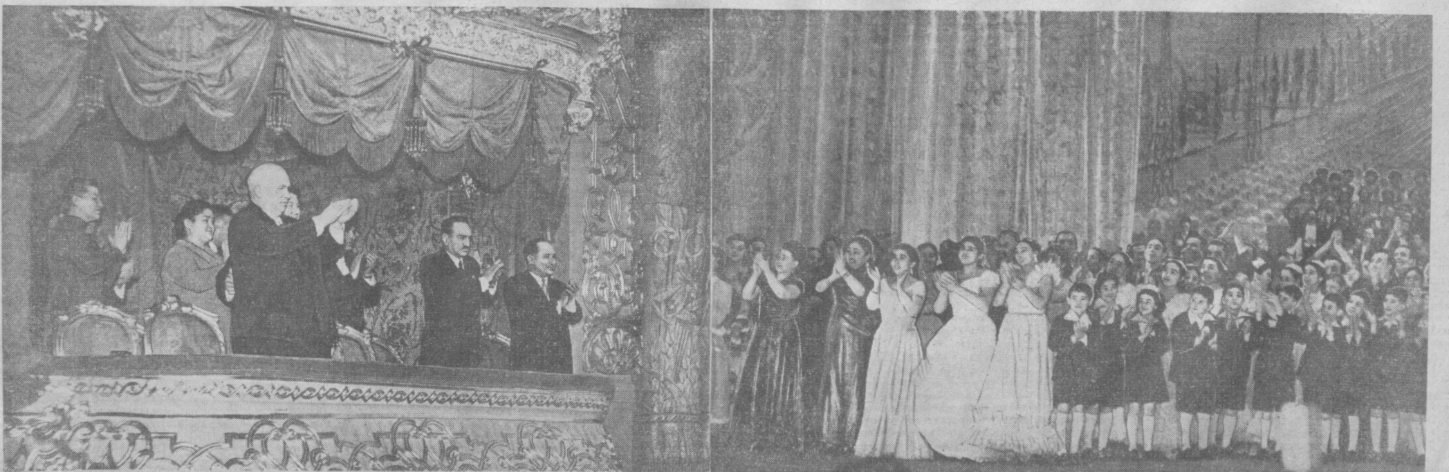
24 февраля в Государственном академическом Большом театре Союза ССР в Москве состоялся заключительный концерт ансамбля искусства и литературы Узбекской ССР. На снимке: руководители партии и правительства приветствуют участников декады.