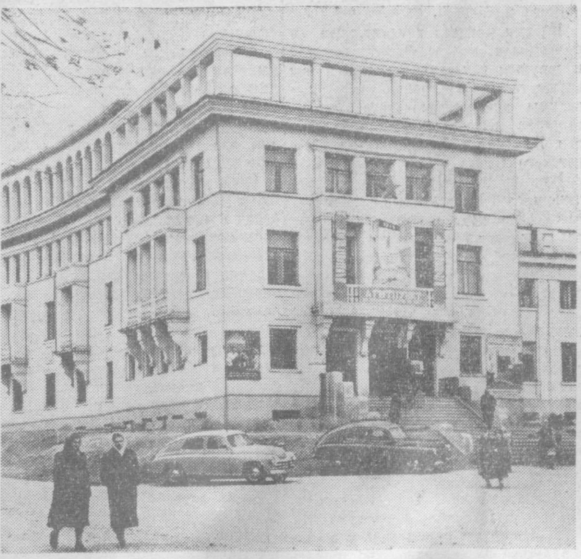
Завтра в 6 часов утра перед трудящимися столицы Узбекистана широко распахнутся двери избирательных участков для того, чтобы избиратели отдали свой голос за своих кандидатов в депутаты Верховного Совета и местных Советов республики. На снимке: на избирательном участке № 147 Фрунзенского района Ташкента.

На всех предыдущих выборах в Советы трудящиеся единодушно голосовали за кандидатов блока коммунистов и беспартийных. Нет сомнения, что избиратели Узбекистана 1 марта дружно придут к избирательным урам и отдадут свой голос за кандидатов могучего народного блока коммунистов и беспартийных, проголосуют за мудрую политику Коммунистической партии, тем самым выразят свою готовность и решимость самоотверженно бороться за досрочное выполнение семилетки, за полное торжество коммунизма в нашей стране. Товарищи избиратели! Завтра — все на выборы!