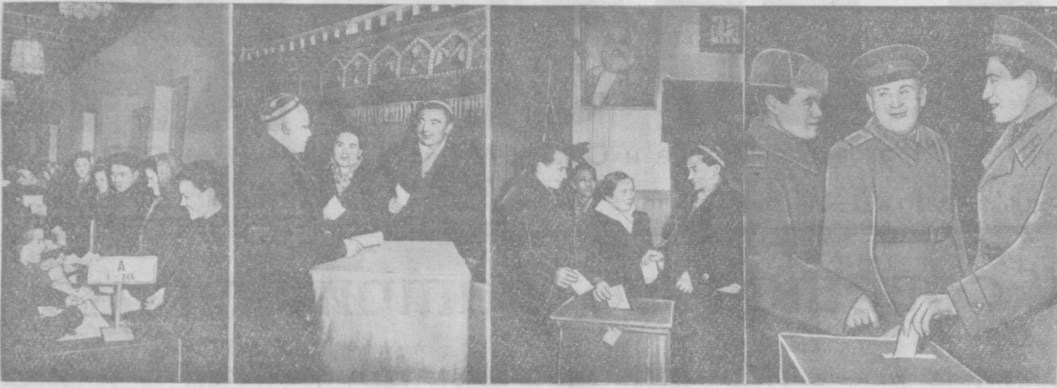
Народ голосует. НА СНИМКАХ: 1. На избирательном участке № 93 Кировского района г. Ташкента. 2. Колхозники сельхозартели имени Кирова, Ордоникидзевского района, пришли исполнить свой долг. 3. Голосование на избирательном участке № 46 Куйбышевского района г. Ташкента. 4. Воины Советской Армии отдадут свой голоса кандидатам народа.