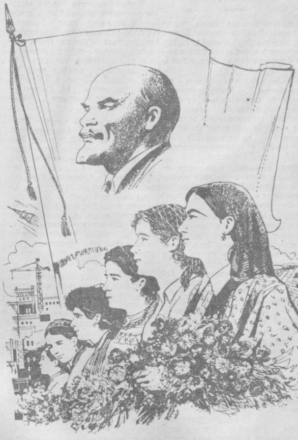
Рис. Г. Шевлякова.

Для участников собрания был дан праздничный концерт. (УзТАГ).