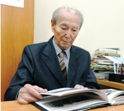
Naim KARIMOV, akademik.

S. Ayniy tilga olgan jamiyat 1910 yilda tashkil etilgan. Shubhasiz, Buxoroda jadidchilik harakatining tug'ilishini faqat mazkur tashkilot va shu sana bilan bog'lab qo'yish to'g'ri emas. Bu tashkilotdan avval Buxoroda yangi usul maktablari ochilgan, hatto mazkur ilm dargohlari uchun o'quv qo'llanmalarini nashr etish maqsadida 1908 yilda "Buxoroi sharif" shirkati tuzilgan. Lekin shu narsa haqiqatki, "jadid" so'zi ham, dastlabki jadidlar ham XX asrning boshlarida paydo bo'lgan.