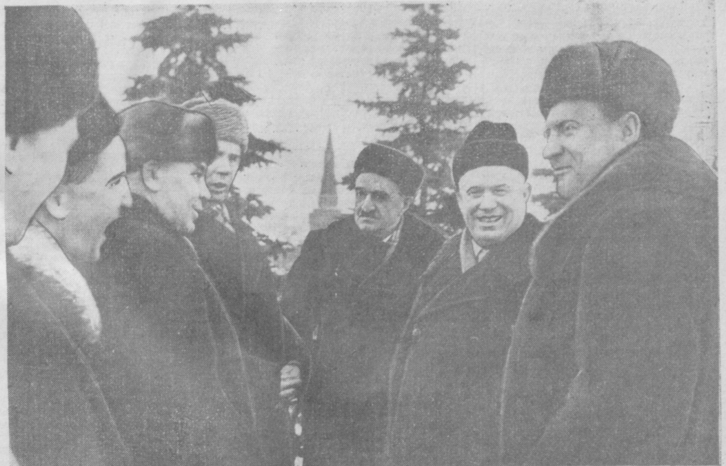
На территории Кремля в перерыве между заседаниями. Н. С. Хрущев, А. И. Микоян и А. И. Кириченко беседуют с делегатами съезда.

XXI съезд не является очередным съездом нашей партии, на нем не заслушивается отчет Центрального Комитета, сказано в своем выступлении тов. М. А. Суслев. Однако в ярком, всеобщем и глубоком докладе товарища Хрущева освещены итоги деятельности партии и всего народа за период между XX и XXI съездами. За этот период страной одержаны всемирно-исторические победы во всех областях общественного хозяйства. Всем миром признаны блистательные успехи, достигнутые советской культурой, наукой и техникой, венцом которых являются советские спутники Земли и первая созданная человеком планета, вращающаяся вокруг Солнца. Советские искусственные спутники Земли и Солнца — это естественные и закономерные спутники социализма, полностью и окончательно победившего в нашей стране.