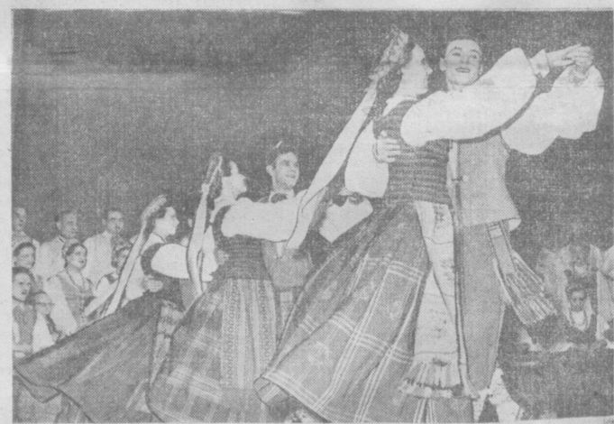
В Ташкенте с большим успехом гастролирует Государственный заслуженный народный ансамбль песни и танца Литовской ССР. На снимке: выступление ансамбля в концертном зале Окружного Дома офицеров.

Слёт принял участие ко всем комсомольцам и молодежи промышленных предприятий области с призывом включить в честь XXI съезда КПСС ряды коммунистических бригад, шире развернуть социалистическое соревнование за досрочное выполнение плана первого года семилетки.