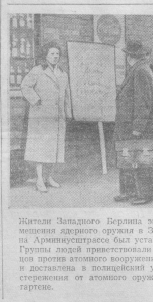
Жители Западного Берлина энергично протестуют против размещения ядерного оружия в Западном Берлине.

БОНН, 10 февраля. (ТАСС). Западногерманская газета «Вестфеллише рундschau» резко критикует воинственное заявление государственного секретаря США Даллеса по берлинскому вопросу.