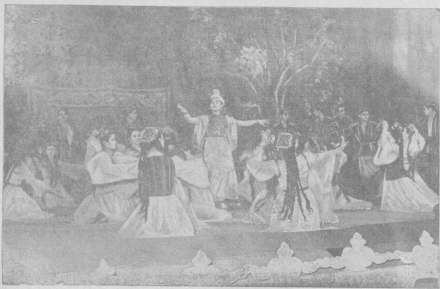
Сцена из нового балета «Мечта» в постановке театра оперы и балета имени Навои.