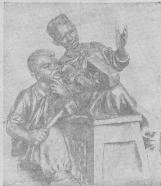
«Юные плотники» — скульптура Ф. Н. Гриценко.

Для меня, как и для других творческих работников нашей студии, эта декада является серьезной проверкой возможностей, вдохновит на новые искания.