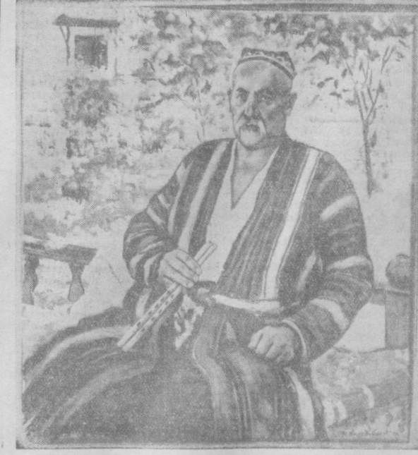
«Народный музыкант Умуразаков» — картина художника Р. Ахмедова.