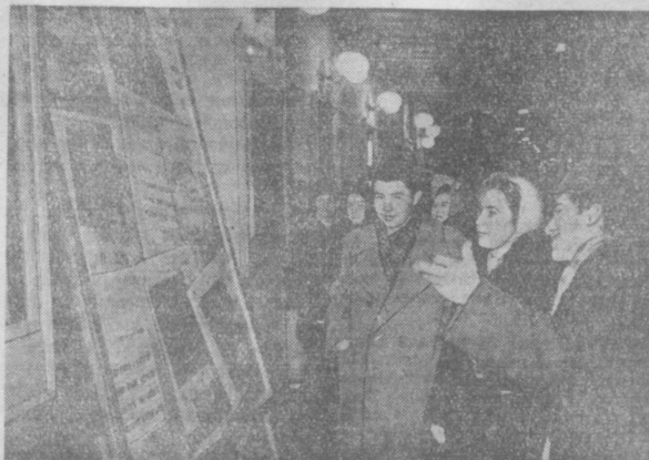
Декада искусства и литературы Узбекистана в Москве. В помещении драматического театра имени А. С. Пушкина спектакль «Дракон и солнце» показал москвичам русский драматический театр имени М. Горького. На снимке: выход в театр имени Пушкина перед началом спектакля.

Коллектив института приложил все силы к успешному осуществлению вдохновляющей, мудрой программы грандиозных работ, начерченной XXI съездом КПСС.