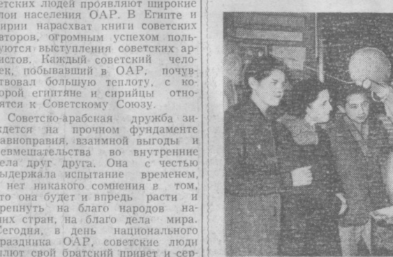
На снимке: посетители выставки у макета третьего искусственного спутника Земли.

Ценным новинкам пополнилась экспозиция Ташкентского музея естественно-научной пропаганды. Наибольшее внимание посетителей привлекает объемный действующий макет, посвященный советским искусственным спутникам Земли. На темном с сияющими искрами звезд фоне, представляющем космическое пространство, медленно вращается вокруг своей оси освещаемая Солнцем Земля — большой голубой шар с выпукло выступающими рельефными изображениями материков. А вокруг по своим орбитам движутся три миниатюрных советских искусственных спутника. Эта интересная модель как и металлический макет третьего искусственного спутника размером в одну треть настоящего изготовлена по заказу музея в механических мастерских Министерства культуры. Посетители музея, приток которых значительно возрос с появлением новых экспонатов, проявляют к ним большой интерес, просят экскурсовода подробнее рассказать об устройстве советских искусственных спутников Земли.