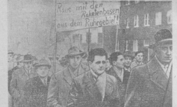
Федеративная Республика Германия. В городе Бохуме состоялась демонстрация и митинг горняков Рура, в которых приняло участие более 80 тысяч человек. Демонстранты направились к заводу концерна «Бохумер ферейн». Выступавшие на митинге требовали установления полной рабочей недели, охраны социальных прав и запрещения строительства ракетных баз на немецкой земле. На снимке: демонстранты на улицах города Бохума.

НЬЮ-Йорк, 21 февраля. (ТАСС). Корреспондент агентства Ассошиэйтед Пресс из Гаваны, сообщая о выступлении по телевидению премьер-министра Кубы Фиделя Кастро, фиксирует внимание на высказывании Кастро в пользу расширения торговли Кубы с другими странами, если американский рынок для ее экспорта будет сокращаться. «Мы должны продавать наш сахар тому, кто хочет его покупать», — сказал Фидель Кастро. — Если Россия хочет получить сахар, мы ей продадим его. Если Китай хочет покупать сахар, мы будем продавать его Китаю. Мы имеем право сами решать наши проблемы». Кастро напомнил, что сенатор США Эллиендер (от штата Луизиана) недавно угрожал Кубе мерами, направленными на сокращение ввоза кубинского сахара в США. «Мне это надоело», — сказал премьер-министр. — Если они (США. — Ред.) хотят покупать