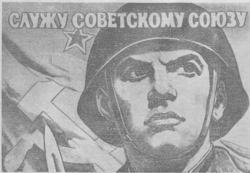
Плакат художника В. Иванова.