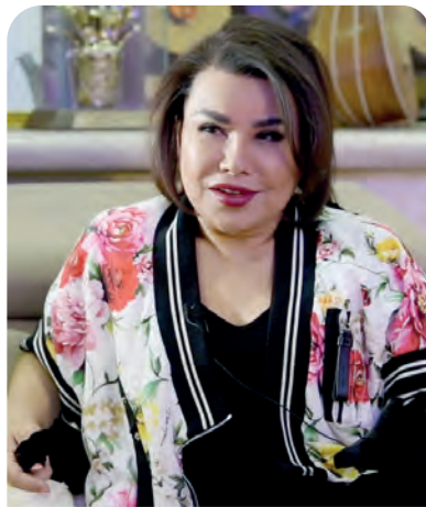
Юлдуз УСМОНОВА, Ўзбекистон халқ артисти: