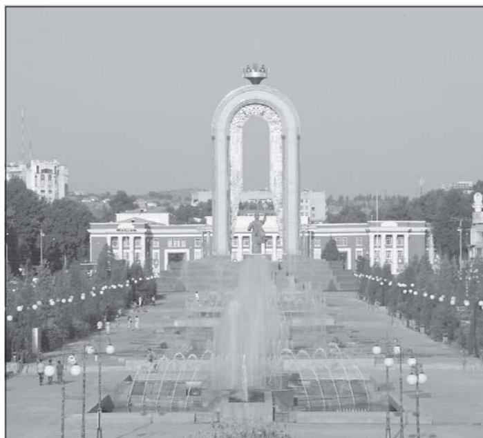
Аҷаб шаҳри дилорой, Душанбе.

9 сентябр – Рӯзи истиқлолияти давлатии Тоҷикистон