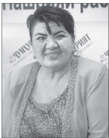
Занон мардона гоҳо ишқ варзанд, Заифҳои мардонро чӣ гуям!