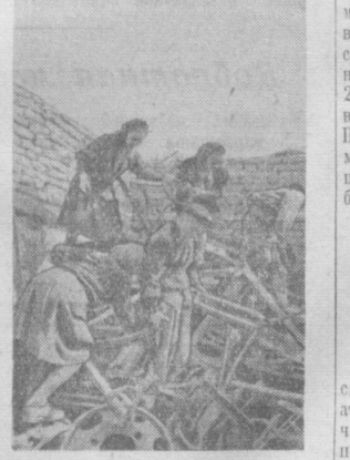
В ответ на обращение ЦК ВЛКСМ к молодежи страны учащиеся нукусской средней школы № 4 имени Сталина решили собрать в этом месяце не менее 50 тонн металлолома. На снимке: ученики 5-го класса утилизируют металлолом на школьном складе.