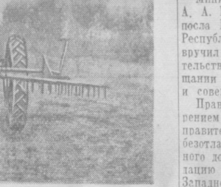
Рабочим органом бороны является зуб квадратного сечения.

Частые весенние ветры наносят большой ущерб хозяйствам Кокандской группы районов: выдувают верхний пахотный слой земли вместе со всходами, способствуют процессу вторичного засоления почвы. Для защиты полей от ветров еще в 1949 году было решено насаждать лесную полосу, которая должна протянуться с юго-востока на северо-запад, поперек напористого господствующих ветров. Прошло 10 лет, а лесная полоса заложена всего лишь на 12 гектарах.