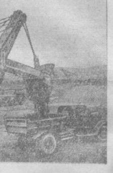
Азербайджанская ССР. В Ани-Байрамлы, на берегу Куры, началось строительство крупной газовой электростанции открытого типа.

Сеятельная бригада Гиталова (Кировоградская область), 1 апреля (ТАСС). Трактористы бригады старательно готовят почву под посев сахарной свеклы и кукурузы. Сейчас здесь началась сев сахарной свеклы. Первые десятки гектаров уже засеяны.