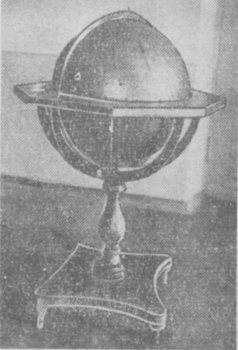
На снимке: старинный глобус.