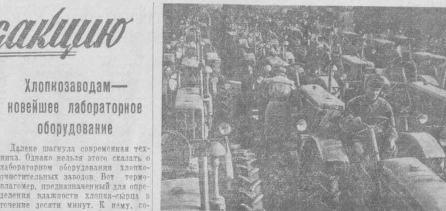
Промышленность Венгерской Народной Республики усиливает снабжение техникой сельскохозяйственных кооперативов.

В Ленинском районе на Кзыл-Аравской, Союзной, Локомотивной улицах, на улице Малькова образовались целые свалки мусора.