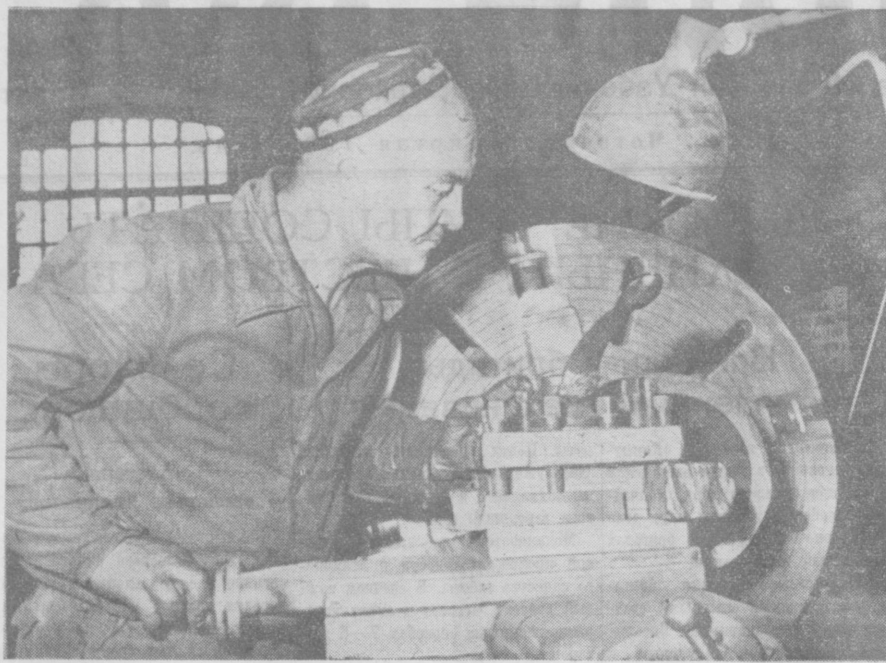
— Есть полторы нормы!