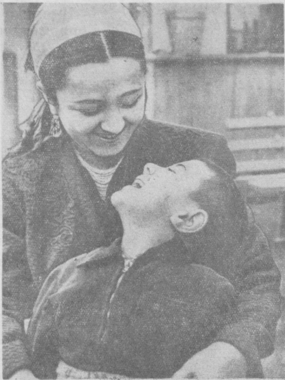
Береги человека, мать. — Сколько дел у него впереди! Сколько радости испытать, сколько трудностей победить...