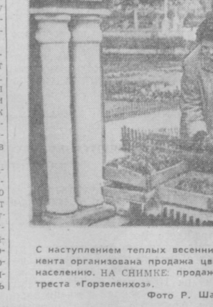
С наступлением теплых весенних дней в цветочных магазинах Ташкента организована продажа цветов и рассады различных растений населению. НА СНИМКЕ: продажа цветов и рассады в магазине № 1 треста «Горзеленхоз».