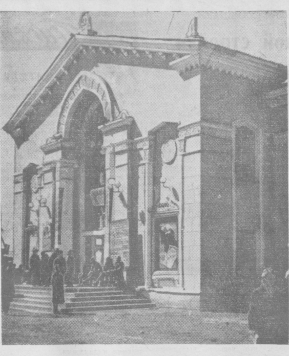
По городам Узбекистана. НА СНИМКЕ: кинотеатр «Узбекистан» в Намангане.