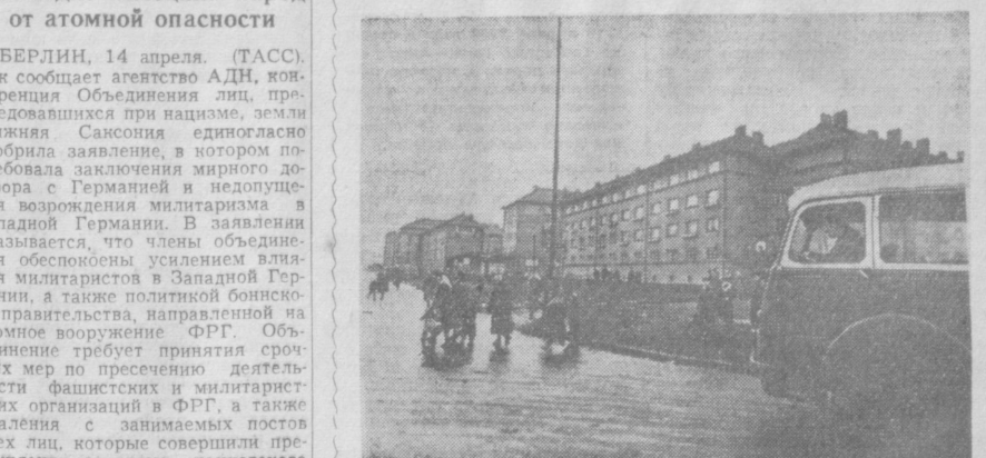
В Чехословацкой Республике вокруг крупных предприятий выросли новые поселки. Около города Кладно Пражской области сооружен поселок имени В. Маяковского с прямыми улицами, благоустроенными жилищными домами, культурно-просветительными учреждениями. Жители поселка — горняки и металлурги. НА СНИМКЕ: на улице нового поселка.