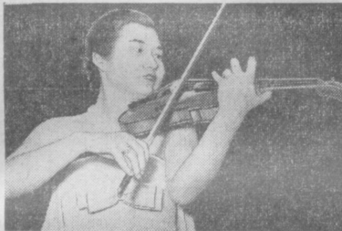
Изящно прозвучала «Хота» де Фалья и «Испанский танец» Гранадоса.

Министерство и ведомственные Х. Цудзи показала также в интересной фантазии Губайна на тему оперы Бизе «Кармен», в Прелюдии и аллегро Пуляни.