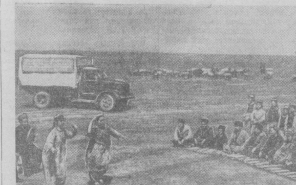
Выступление кружка художественной самодельности школы нарководческого совхоза «Нишан» на одной из ферм совхоза (Кашка-Дарья).

Труженники сельского хозяйства этих районов также приняли на себя социалистическое обязательство по досрочному выполнению заданий семилетнего плана. Одна из них первейшая обязанность.