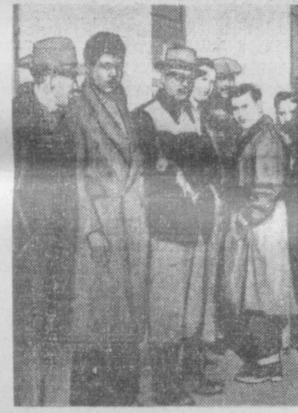
НА СНИМКЕ на улице Детройта. Очередь безработных перед одним из отделов социального обеспечения штата Мичиган.

ДЛЯ РАБОТЫ в вечернем филиале Казахского технологического института в г. Джамбуле. На замещение вакантных должностей.