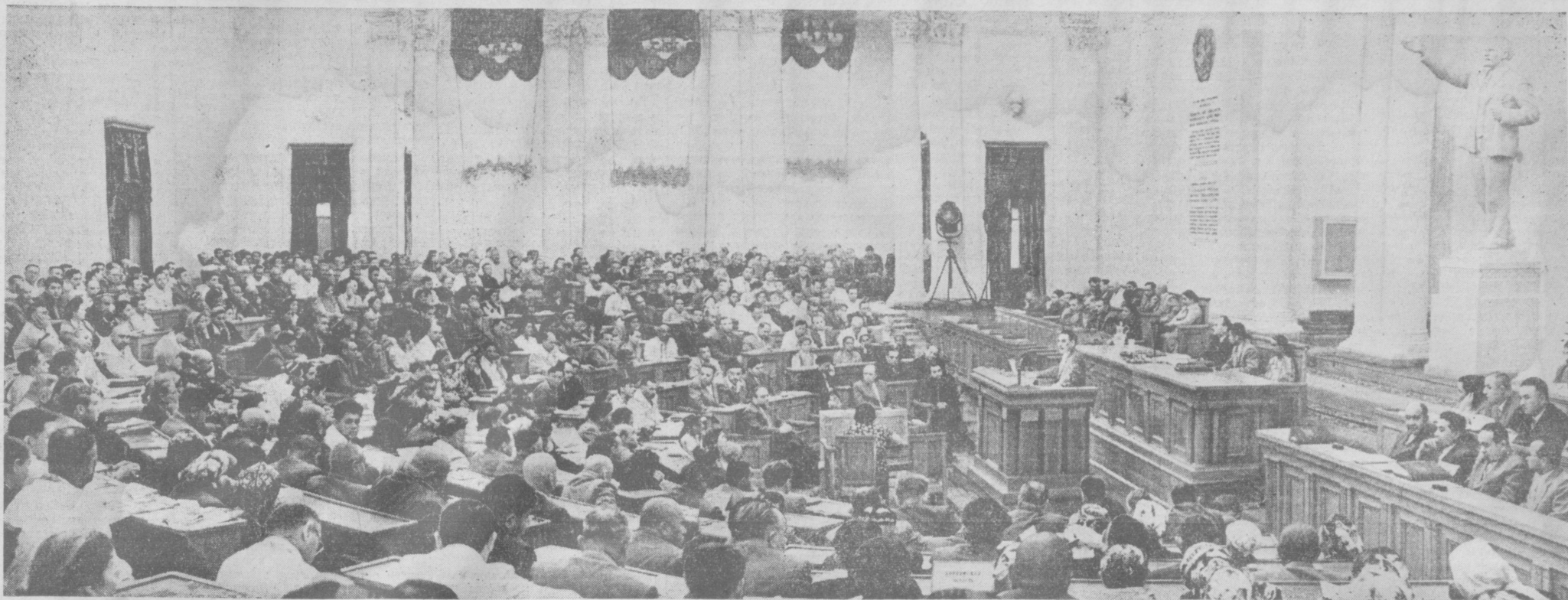
НА СНИМКЕ: в зале заседаний второй сессии Верховного Совета Узбекской ССР пятого созыва.