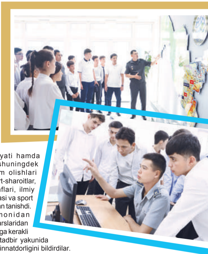
Mayor Sherqo'zi XAKIMOV

Kursantlar tomonidan o'tkazilgan mahorat darslaridan o'quvchi-yoshlar o'zlariga kerakli ma'lumotlarni oldi va tadbir yakunida tashkilotchilarga o'z minnatdorligini bildirdilar.