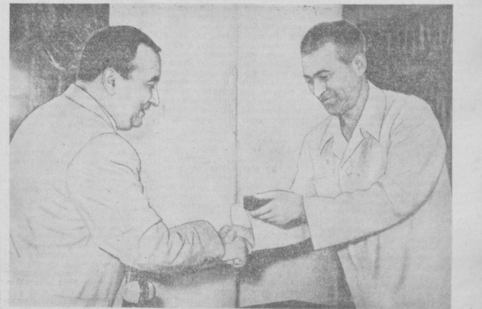
НА СНИМКЕ: первый секретарь ЦК КП Узбекистана, член Комитета по Ленинским премиям в области литературы и искусства при Совете Министров СССР Ш. Р. Рашидов вручает Ленинскую премию президенту Академии наук Узбекской ССР, члену-корреспонденту Академии наук СССР Х. М. Абдуллаеву.