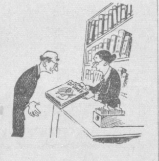
Рис. М. Воробейчинова.

Некоторые городские и сельские библиотеки в республике не проводят массово-политической и культурно-просветительной работы с читателем.