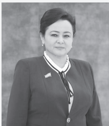
Зумрад БЕКАТОВА, Олий Мажлис Қонучилик палатаси депутаты

Мамлакатимизда кейинги йилларда соғлиқни сақлаш тизимини такомиллаштириш, соҳани жаҳон андозаларига мослаштириш, тиббий хизмат сифати ва самарадорлигини ошириш, аҳоли саломатлигини сақлаш борасида белгиланган устувор вазифалар ижросини таъминлаш бўйича тизимли ва кенг кўламли ишлар қилинмоқда.