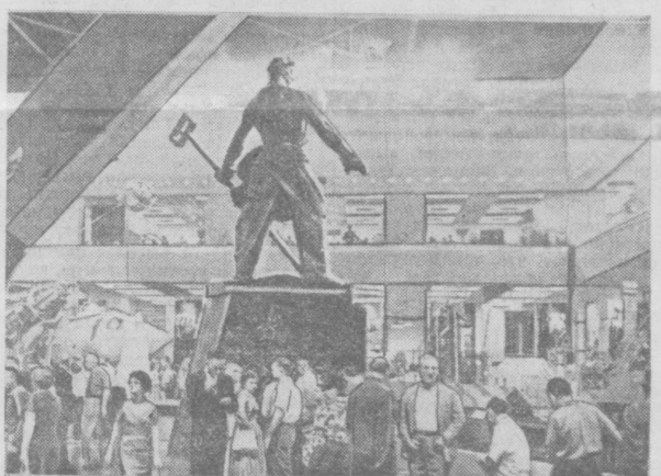
Советская выставка в Нью-Йорке. В центральном зале.