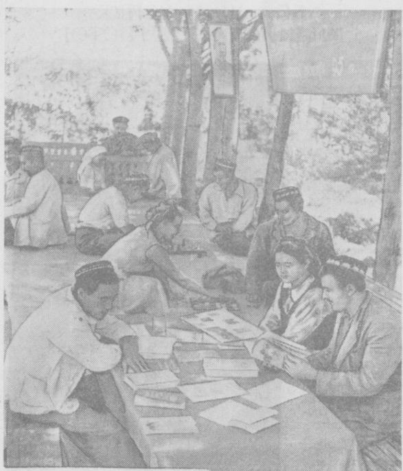
В колхозе «Октябрь», Гулистанского района, много внимания уделяется политико-массовой работе среди хлопководов...