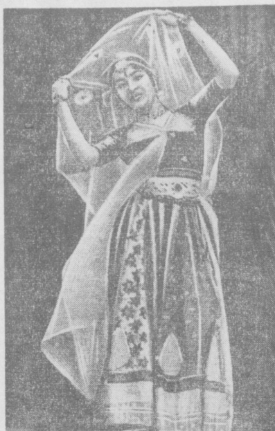
Ташкентцы не впервые знакомятся с замечательным искусством дружественной Индии. Выступления индийских артистов, помогающих нам познать яркое, самобытное искусство этой великой страны. Уже три вечера подряд в концертном зале Узбекской филармонии с неизменным успехом выступают индийские певицы, танцовщицы, музыканты.