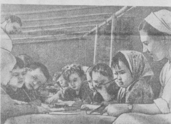
«Мы будем художниками». В летнем саду колхоза «40 лет Октября», Чиназского района, Ташкентской области.