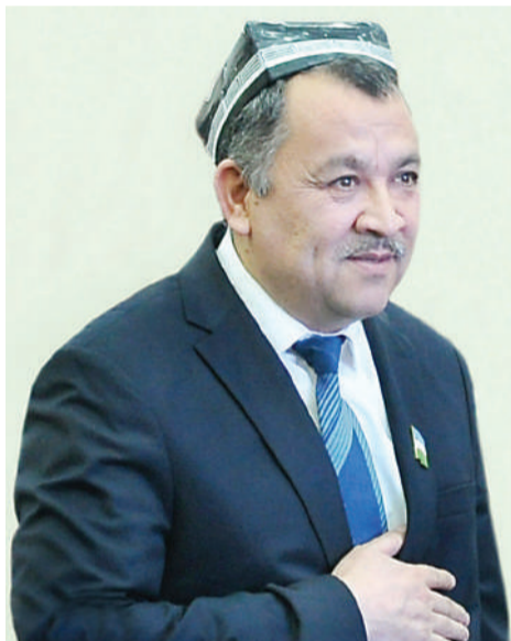
Иброҳимжон СУЛТОНОВ, Марғилон “Хунармандлар маркази” раҳбари, Ўзбекистон Республикаси Олий Мажлиси Сенати аъзоси.