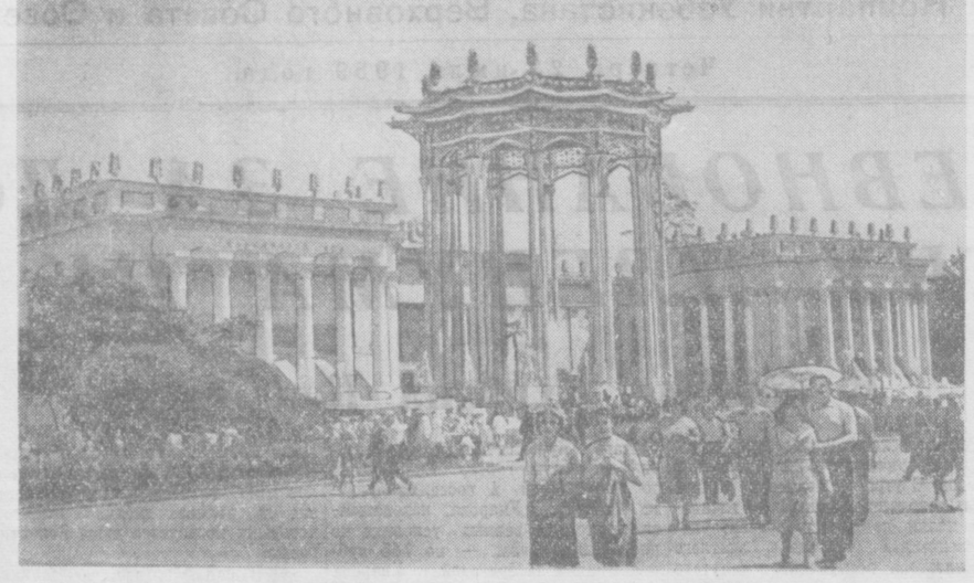
Павильон Узбекской ССР на Выставке достижений народного хозяйства СССР.