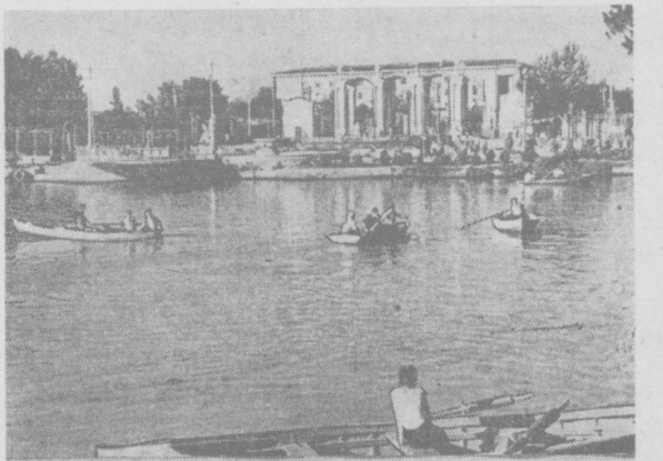
На Комсомольском озере Ташкента.

*) Александр Панов. Жизнь только начинается. ГИЛ УэССР. Ташкент, 1959 г.