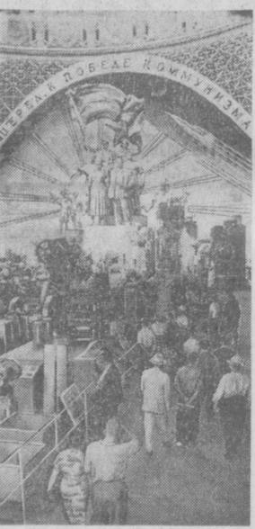
Выставка достижений народного хозяйства СССР в павильоне «Машиностроение».

Комитет разрабатывает широкий план мероприятий по проведению юбилея в Москве, столицах союзных республик, в городах и селах страны. (ТАСС).