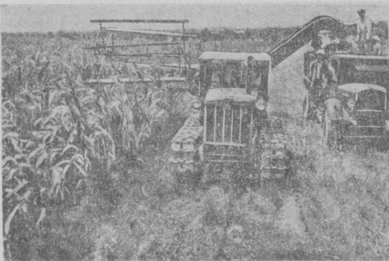
В колхозе «Кзыл Узбекистан», Ордоникинидзевского района, началась ноябрьская уборка кукурузы. В этом году будет заложено на силос более шести тысяч тонн зеленой массы.