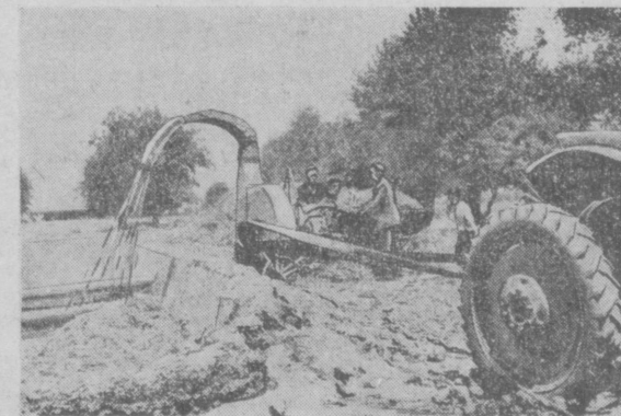
Колхоз «Коммунизм», Шахрисабзского района, решил заготовить в этом году 820 тонн силоса — в два раза больше, чем в прошлом году.