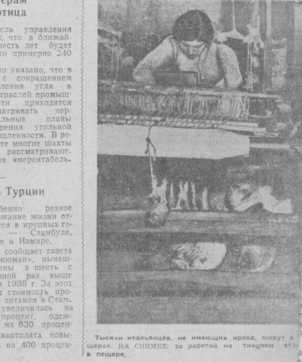
Тысячи итальянцев, не имеющих крова, живут в щерах. НА СНИМКЕ: за работой на тшадном этапе в пещере.

16 апреля в газете «Правда Востока» был опубликован фельетон «Тета Липа и автоматика», где рассказывалось о судьбе известного завода-автомата, оборудование которого более двух лет, ржавеет и разрушается, превращаясь во дворе жилого дома по улице Большой Алмазской, причем в Министерстве строительства УзССР даже ничего не знали о его существовании. Как же реагировало министерство на сигнал газеты? Разно три месяца спустя в редакцию за подписью заместителя министра строительства т. Скребева пришел ответ, где указывалось, что «факты подтвердились», а виновные наказаны. «В настоящее время», — говорилось далее в письме, — министерством принимаются меры к использованию оборудования указанного известной установкой». Газета в следующем номере сообщила, что все еще только принимаются меры! Когда же будет работать завод-автомат?