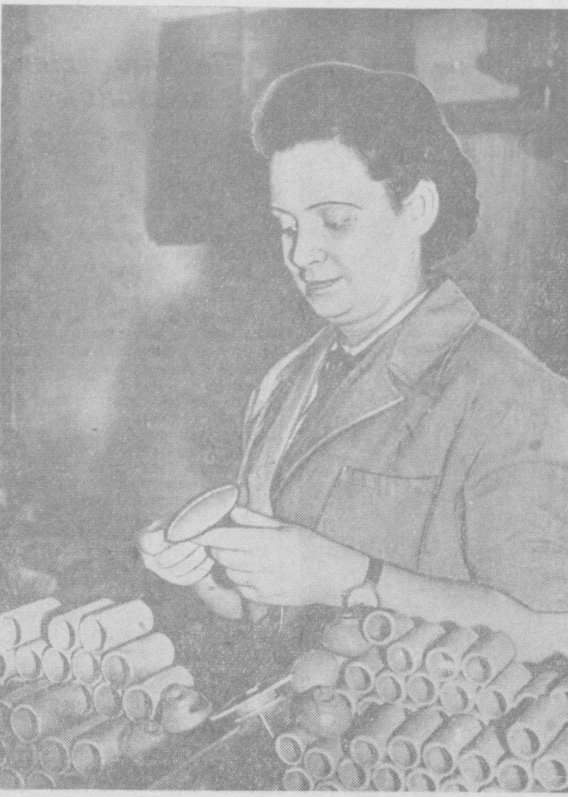
Ташкентский завод «Авторемдеталь» недавно освоил серийный выпуск автомобильных деталей из капрона...