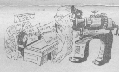
Рис. Н. Меламеда.