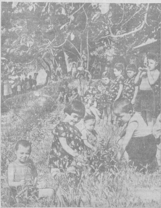
На снимке: в детском саду колхоза «Кзыл Узбекистан», Орджоникидзевского района.