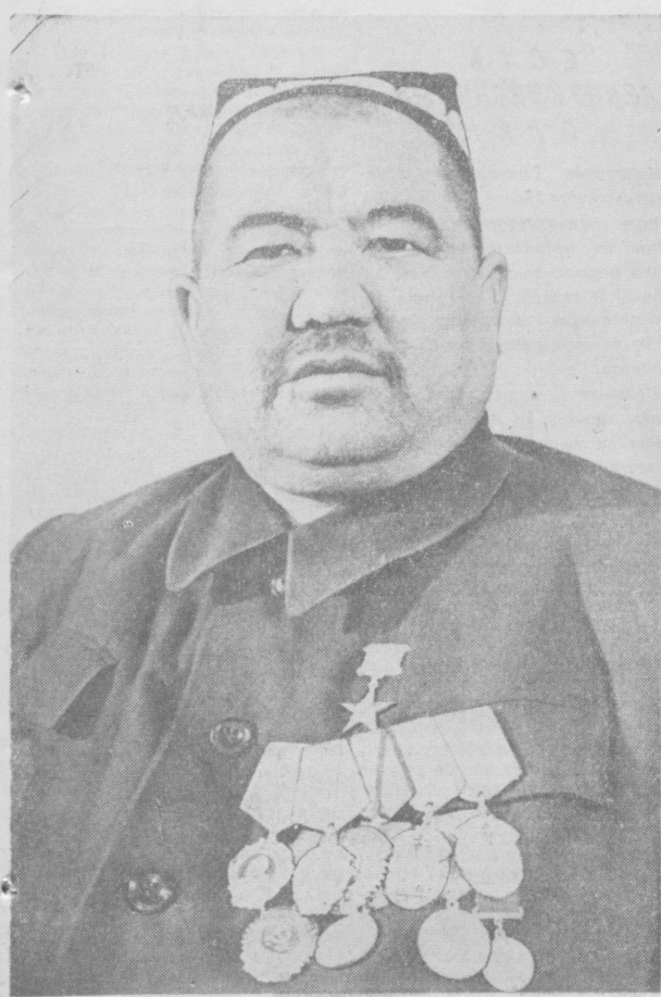
ГАНИШЕР ЮНУСОВ, Герой Социалистического Труда.