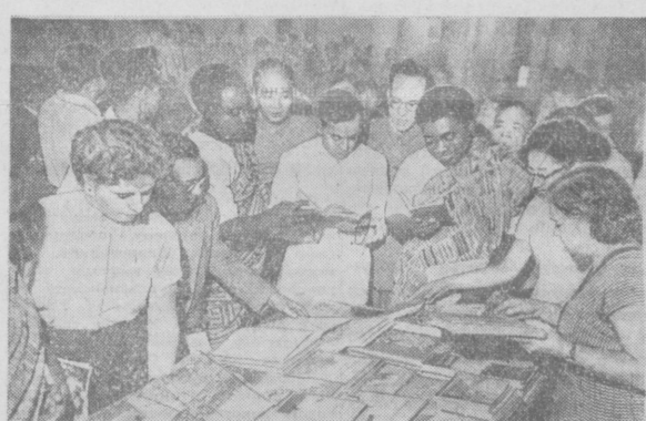
Участники семинара кооператоров стран Азии и Африки у книжного киоска.

Найдены новые формы для максимального приближения к жизни подготовки работников массовых профессий. В Ташкентской и Самаркандской областях открыты первые магазины-школы. В срок от шести месяцев до одного года молодежь овладевает в этих школах профессией продавца. По такому же принципу организованы школы-столовые и школы-пекарни. На базе передовых предприятий торговли и общественного питания широко организовано бригадное и индивидуальное ученичество.