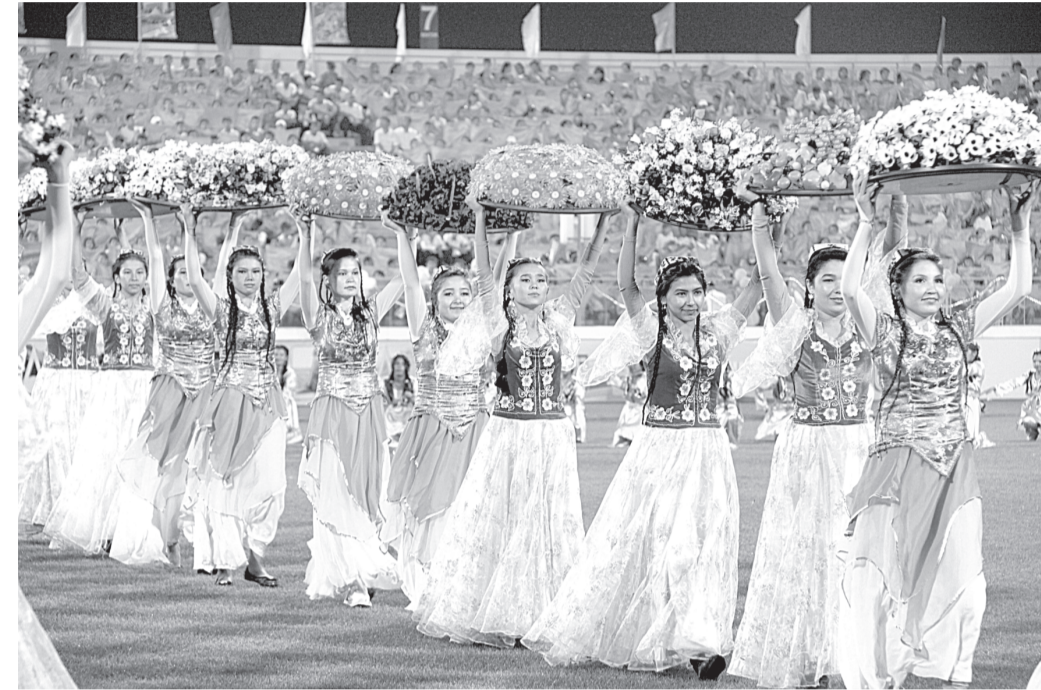
мукофотлари билан тақдирланди.