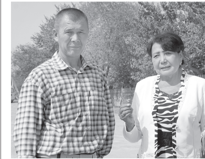
Мауритио Чампио: «Ўзбекистон — улкан имкониятлар мамлақати»

Кўтаринки кайфиятда суҳбатлашиб турган бу икки оҳангаронликнинг қувончи чексизлиги бежиз эмас. Президентимизнинг Фармонида мувофиқ, мустақилликимизнинг 23 йиллиги муносабати билан уларнинг меҳнати юксак баҳоланди.