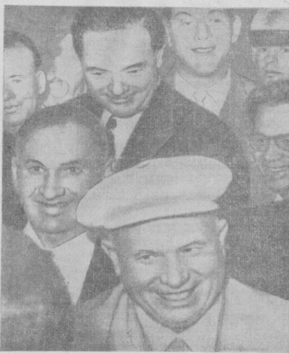
США. Председатель Совета Министров СССР Н. С. Хрущев во время посещения профсоюза портовых грузчиков и складских рабочих в Сан-Франциско.