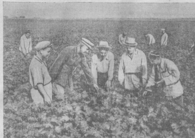
На поля сельхозартели «Северный маяк» Урта-Сарайского района, прибыла взаимопроверочная бригада Янгй-Юльского района.