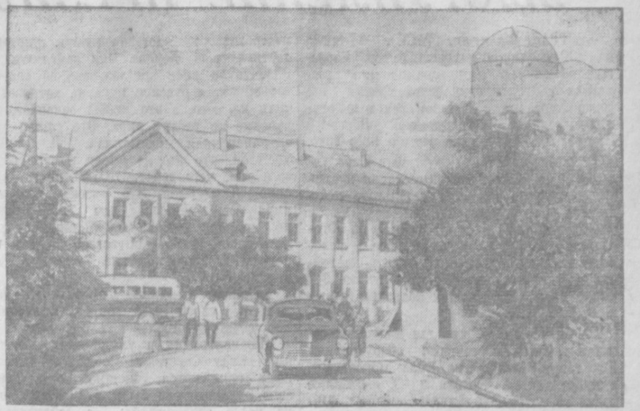
По городам Узбекистана. На снимке: здание средней школы имени Ворошилова в городе Хиве.