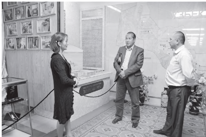
■ Зарафшон шаҳридаги ўлкашунослик музейида.

Кизилқум уммонида Учқудуқ мўъжизагина оролчани эслатиб, гўё чўл бағрида сароб моддийлашгандек туюлади. Осмонўпар бинолар, шарқираган фавворалар, йирик саноат корхоналари, тупроғидан олтин унувчи замин оддийгина ҳақиқатлиги билан бирга халқнинг метин иродаси, реза-