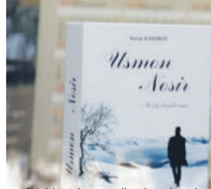
Adabiyotshunos olimning shunday satrlari bor ekan: