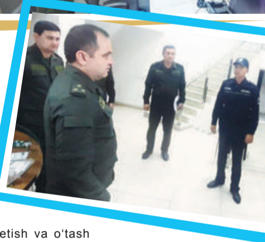
Adliya mayori Qudrat ERGASHEV, Respublika Harbiy prokuraturasi bo'lim harbiy prokurori