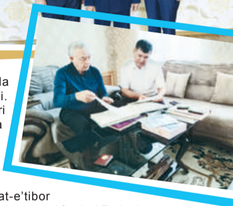
Otabek XOLBOYEV, O'zbekiston Respublikasi Harbiy prokuraturasi birinchi o'rinbosari