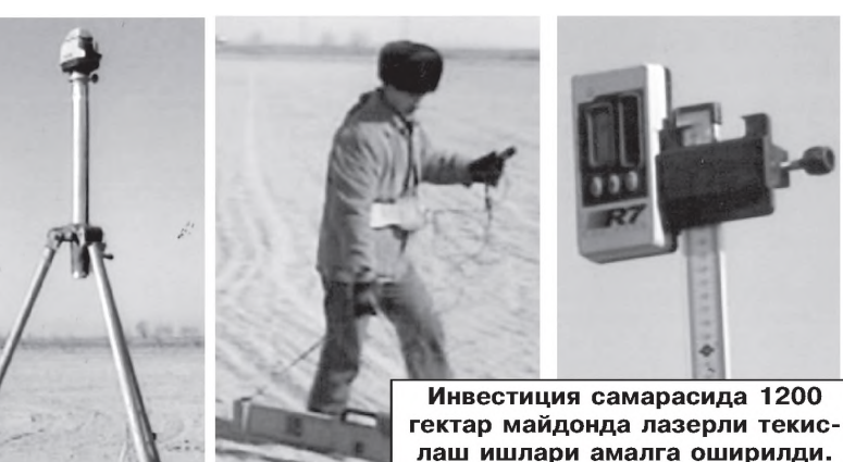
Инвестиция самарасида 1200 гектар майдонда лазерли текислаш ишлари амалга оширилди.

дан Зомин тумани фермер ҳўжаликлари учун 16 та замонавий комбайн, 3 та экскаватор, автокран, тракторлар келтирилди. Шунингдек, тумандаги ҳўжаликлараро ва ички ҳўжалик ирригация ва дренаж тармоқларини таъмирлаш-тиклаш ишлари бўйича зовур ва ёпиқ дренажларда тозалаш, ювиш ишлари олиб борилди. Лойиҳа доирасида амалга оширилган тадбирлар натижасида тумандаги 3 минг гектар сугорилмаган ерларнинг сув таъминоти ва мелiorатив ҳолати яхшиланишига эришилди.