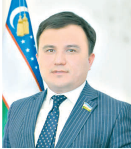
Одилжон ТОЖИЕВ, Олий Мажлис Қонунчилик палатаси Спикери ўринбосари

Давлатимиз раҳбарининг АҚШга ташрифи гоят сермахсул бўлди. Нуфузли мамлакатлар ва халқаро ташкилотлар, бизнес оламининг етакчилари билан ўтказилган учрашув ва музокаралар, БМТ Бош Ассамблеяси 78-сессиясидаги нутқ ҳали тарих саҳифаларида кўп эсга олинади, таҳлил қилинади.