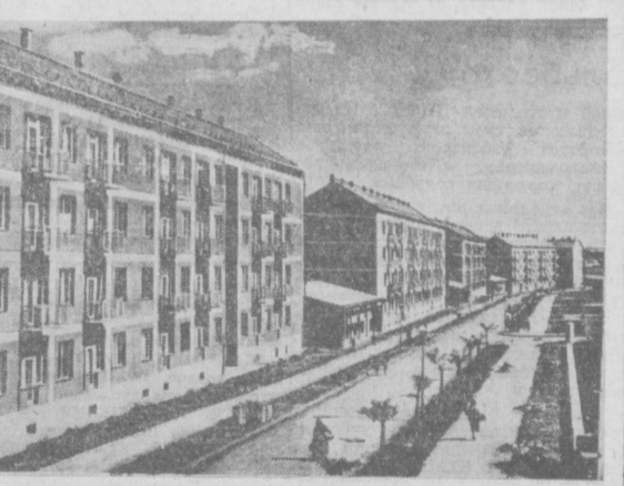
Новые жилые дома в городе Печ (Венгерская Народная Республика).

Весь фильм решен в своеобразной романтической форме. Красочные декорации, умело примененные средства кинематографа — от музфильмации до комбинированных съемок.