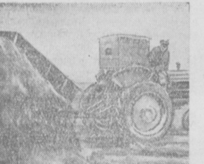
На снимке: механизированная выгрузка местных удобрений.